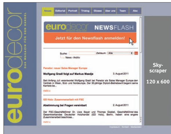
Skyscraper 120 x 600

Die maximale Dateigröße für Banner beträgt 60 KB.